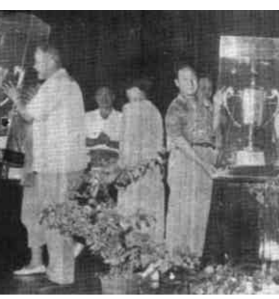
图为省交通厅、省公路局和市领导向夺得“山东公路杯”的市公路局颁发奖杯。

经过广大干部职工的奋力拼搏，我市创杯活动成果辉煌。据统计，去年共完成投资19498.17万元，占年度计划的104.89%，比上年同期增长12.74%，实现了省里要求的保10争12的目标。养路费支出8478.99万元，占年度计划的99.43%。完成新建、改建工程四项，共65.7公里，投资2740万元，经验收全部达到优良级标准。完成大、中修工程18项、93.8公里，总投资860.9万元，疏通公路边沟26公里，建平交道涵178座，硬化平交道口375处，新补植乔木7500株，灌木12.3万株，蜀葵花20公里，成活率达93%，保存率91%，完善GBM工程57公里，公路好路率达